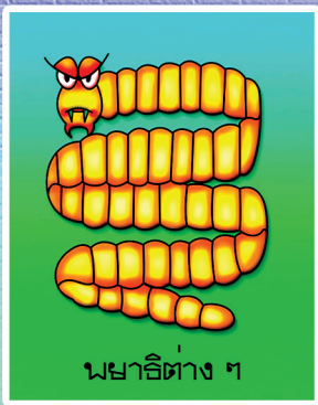
พยาธิต่าง ๆ

พยาธิต่าง ๆ แบคทีเรีย ไวรัส สามารถติดมากับมือในการทำกิจกรรมต่าง ๆ หรือใช้มือสัมผัสสิ่งสกปรก หรือแม้แต่ร่างกายของเราเอง เพราะเชื้อโรคมีอยู่ทั่วไปในสิ่งแวดล้อม หากมือสัมผัสอุจจาระ แผล ฝี หนอง สิว ขยะ สิ่งสกปรกต่าง ๆ แล้วไปสัมผัสอาหาร อาจทำให้อาหารปนเปื้อนแล้วติดต่อไปยังผู้บริโภคได้ หรือหากเราใช้มือหยิบอาหารเข้าปากก็จะทำให้เราได้รับเชื้อโรคเหล่านั้นได้