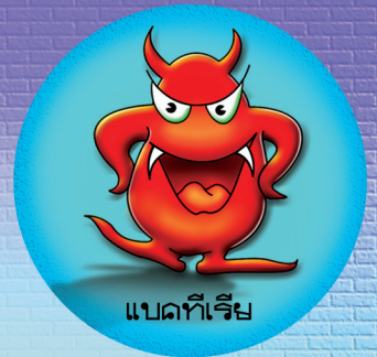
แบคทีเรีย

พยาธิต่าง ๆ แบคทีเรีย ไวรัส สามารถติดมากับมือในการทำกิจกรรมต่าง ๆ หรือใช้มือสัมผัสสิ่งสกปรก หรือแม้แต่ร่างกายของเราเอง เพราะเชื้อโรคมีอยู่ทั่วไปในสิ่งแวดล้อม หากมือสัมผัสอุจจาระ แผล ฝี หนอง สิว ขยะ สิ่งสกปรกต่าง ๆ แล้วไปสัมผัสอาหาร อาจทำให้อาหารปนเปื้อนแล้วติดต่อไปยังผู้บริโภคได้ หรือหากเราใช้มือหยิบอาหารเข้าปากก็จะทำให้เราได้รับเชื้อโรคเหล่านั้นได้