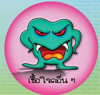
เชื้อโรคอื่น ๆ